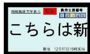
5文字スクロール表示