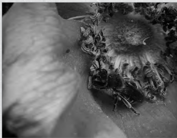
ハマナスの花に訪れたハチの仲間

2014年10月に春国岱第一砂丘に25m四方のエゾシカ防除柵を設置し開始されたハマナス群落保全プロジェクト。その成果が少しずつですが出始めています。調査開始時15cm以下だったハマナスの樹高は柵内では30cm以上にまで回復しています。また、ハマナスを含めた植物の被度（植物が地面をどれくらい覆っているかを示す値）も柵内では柵外に比べ有意に高い値を示しています。これらの事から、ハマナスをはじめとする植物が順調に回復しているといえます。さらにうれしい報告があります、7月6日に昆虫の調査を行ったのですが、柵外に比べ、柵内では昆虫の種類も個体数も多くなりました。まだ詳細な分析を行っていないのですが、ハマナス群落が回復