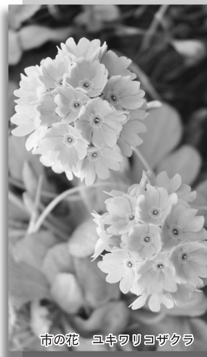
市の花 ヨキワリコザクラ

日 9月19日(金)～23日(火)9時～19時 場 総合文化会館多目的ホールほか 問 市総合文化会館内(第61回写真道展根室巡回展実行委