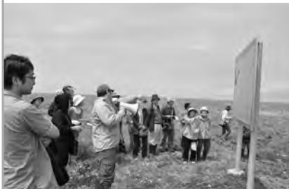
根室史跡めぐり見学会の様子

開催する時期につきましては、広報ねむろや新聞などで周知いたしますので、ぜひ、参加してください。