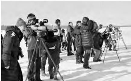
バードウォッチングを楽しむ市民・観光客ら