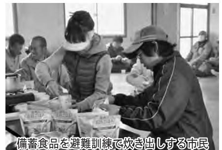
備蓄食品を避難訓練で炊き出しする市民