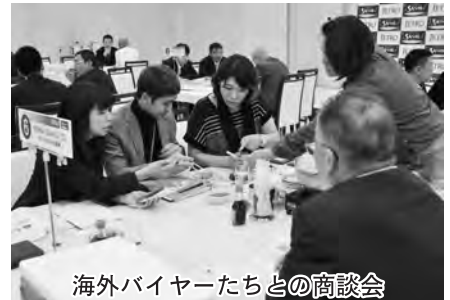
海外バイヤーたちとの商談会