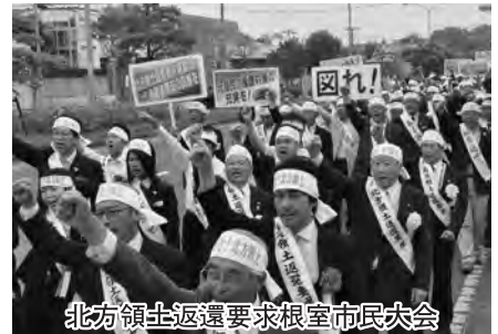
北方領土返還要求根室市民大会