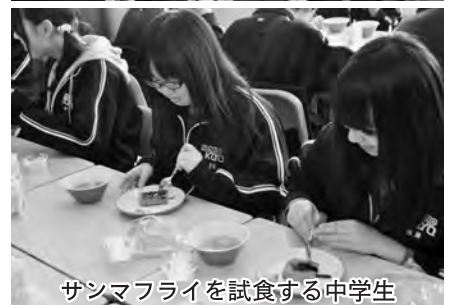
サンマフライを試食する中学生