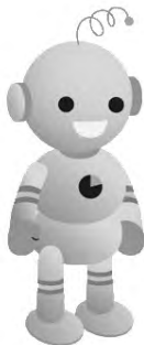
工業統計キャラクター コウちゃん