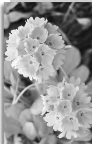
市の花 コキワリコザクラ

貸付対象 医学生(医学を履修する大学または大学院の医学研究科に進学・在学する方)、研修医(医師法に規定する臨床研修を行っている医師)、保健師・助産師・看護師・准看護師・診療放射線技師・臨床検査技師・理学療法士・作業療法士・臨床工学技士(学校または養成所に進学・在学する方) 貸付額(月額) 医学生・研修医30万円以内(医学生は入学