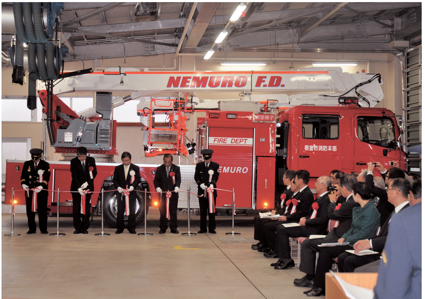
屈折はしご付消防ポンプ自動車納車式 (消防本部) 平成25年10月11日撮影 (撮影者: 港屋 斗偉くん)