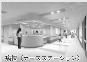
病棟 (ナースステーション)