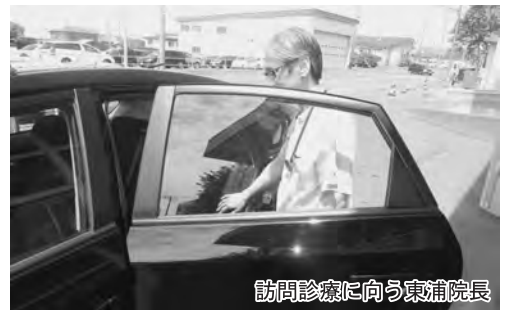
訪問診療に向う東浦院長