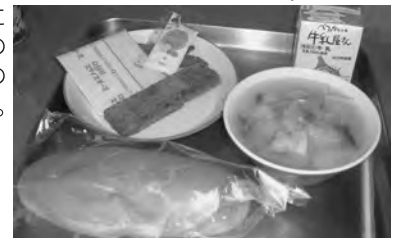
東海大学との共同により開発された「サンマフライ」が、小中学校の給食に登場し好評を得る。