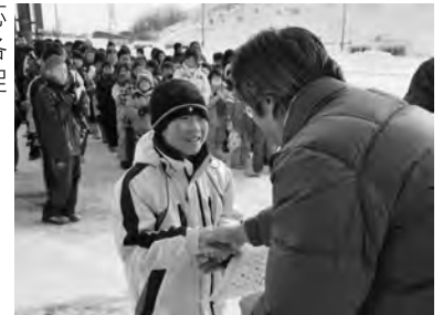
昨年10月、試行で始まった「わんぱくチャレンジ」の第1号達成者を表彰。