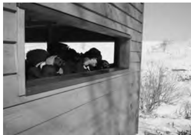
明治公園のハイドを利用した「初心者探鳥会」が人気を集める。