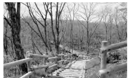
毎年植樹祭が開催され、市民の憩いの場となっている「市民の森」。