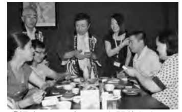
「根室サンマ祭り」を開催したベトナムの日本食料理店で、根室産サンマを積極的にPR。