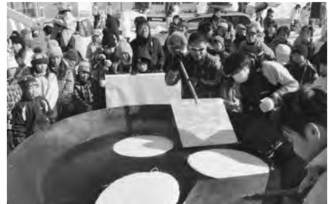
ジャンボホットケーキに挑戦

アイスレストランでは、鹿肉やカレーライス、チーズフォンデュなどの販売とホットミルク、ココア、タラの三平汁が無料で配布され、来場者は熱々のメニューで、ホットしたひとときを過ごしました。