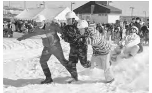
白熱の雪上人間ばんばレース

えた「根室ギネスに挑戦!」の今年のメニューは「ホットケーキ」。大きなフライパンを覗きこむように子どもたちが集まり、甘い香りのホットケーキがおいしく焼き上がるのを楽しみに待っていました。