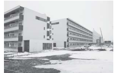
市営住宅の建て替えが進む光洋団地