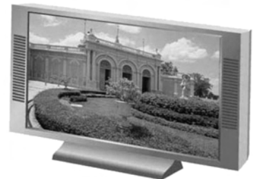
地上デジタル放送対応テレビ