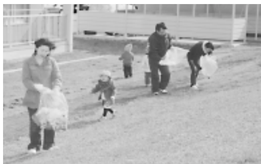
春の全市一斉清掃 住みよい環境づくりのため今年も町内会をはじめ98団体が参加し、道路沿線や公園などの清掃が市内全域で行われました。(4月12日：であえ～る明治団地)