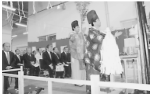
根室漁協花咲製氷・冷凍第一工場竣工式 平成20年8月に着工した「地球環境にやさしい自然冷媒使用」の工場が完成し、竣工式が行われました。(4月16日：花咲製氷・冷凍第一工場)