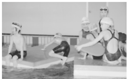
温水プール開館記念無料開放 開館記念に行われる無料開放に、今年は150人余りの市民が訪れ、元気なちびっ子たちの歓声が響きわたりました。(4月12日：温水プール)