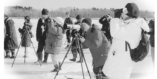
多くの野鳥ファンを魅了した「根室バードランドフェスティバル」平成21年2月