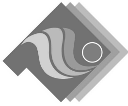
全道障害者スポーツ大会のロゴマーク