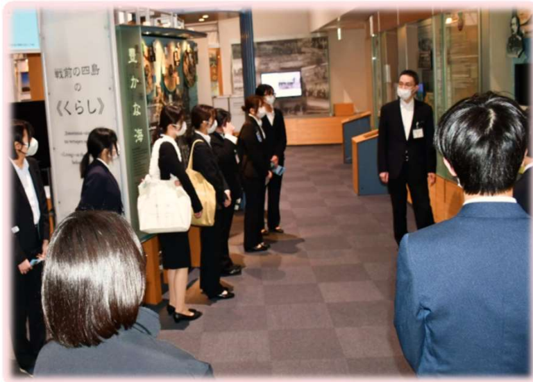
▲▼4/23 説明員から説明を受ける新人職員