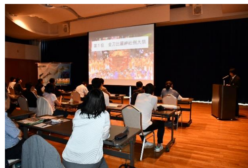
【8/25 茨城県 根室高校出前講座】