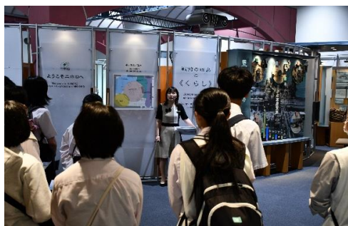
【8/6 山口県 展示ホールにて】