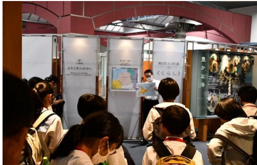
【8/1 鳥取県 展示ホールにて】