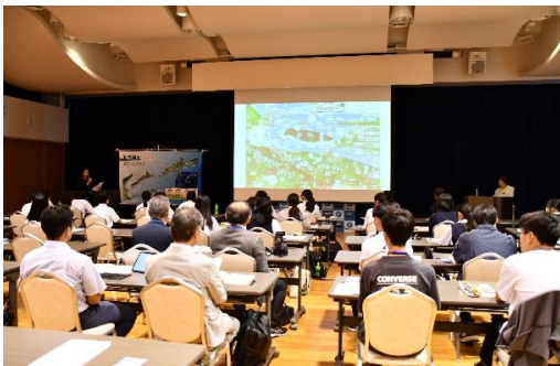
【8/7 兵庫県/京都府 鈴木咲子さん講話】