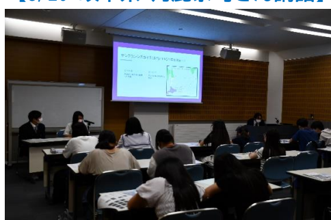
【8/21 静岡県 根室高校出前講座】