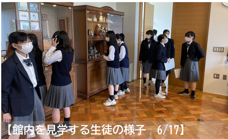
【館内を見学する生徒の様子 6/17】

根室管内の小中学生が北 方領土問題について学ぶ 「北方少年少女塾」が、6 月10日から始まり、6 月10日から始まりました。 津町立津中学校の生徒 の皆さんです。