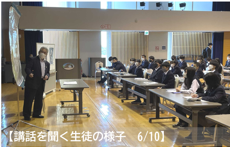
【講話を聞く生徒の様子 6/10】

根室管内の小中学生が北 方領土問題について学ぶ 「北方少年少女塾」が、6 月10日から始まり、6 月10日から始まりました。 津町立津中学校の生徒 の皆さんです。