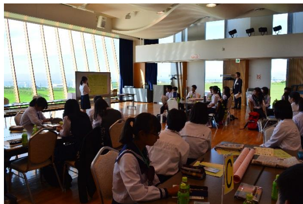
富山県、和歌山県、鳥取県青少年現地視察団