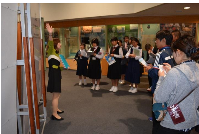
鹿児島県青少年現地視察団