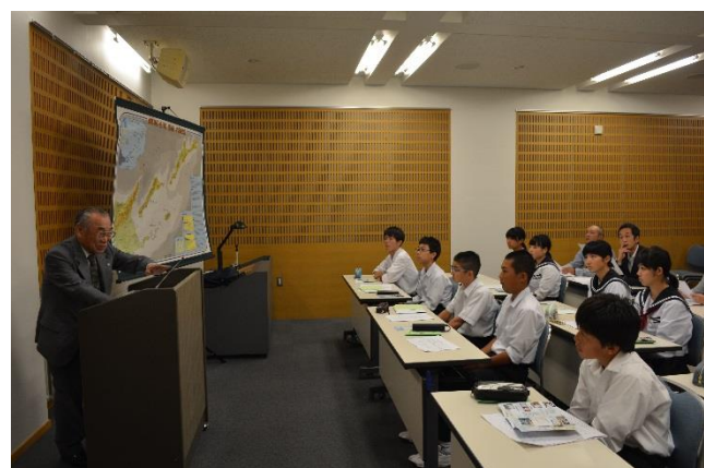
青森県青少年現地視察団