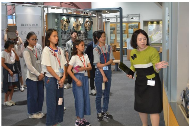
茨城県青少年現地視察団