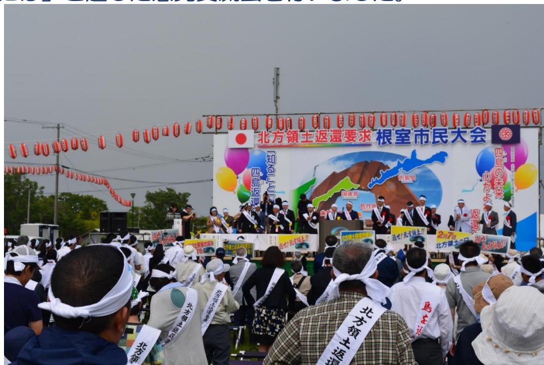
根室市民大会（二ホ口横特設会場）

また、同日午後からは富山県、和歌山県、鳥取県青少年現地視察団が根室市内の中学生と「北方領土ビンゴ大会」や「北方領土問題を知ってもらうには」と題した意見交流会を行いました。