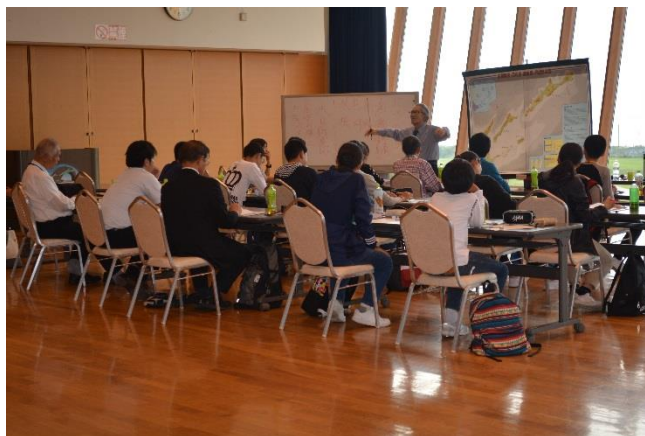
香川県青少年現地視察団