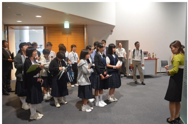
大阪府青少年現地視察団