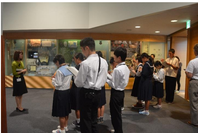
鳥取県青少年現地視察団