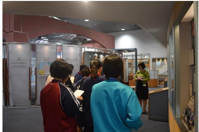
沖縄県青少年現地視察団