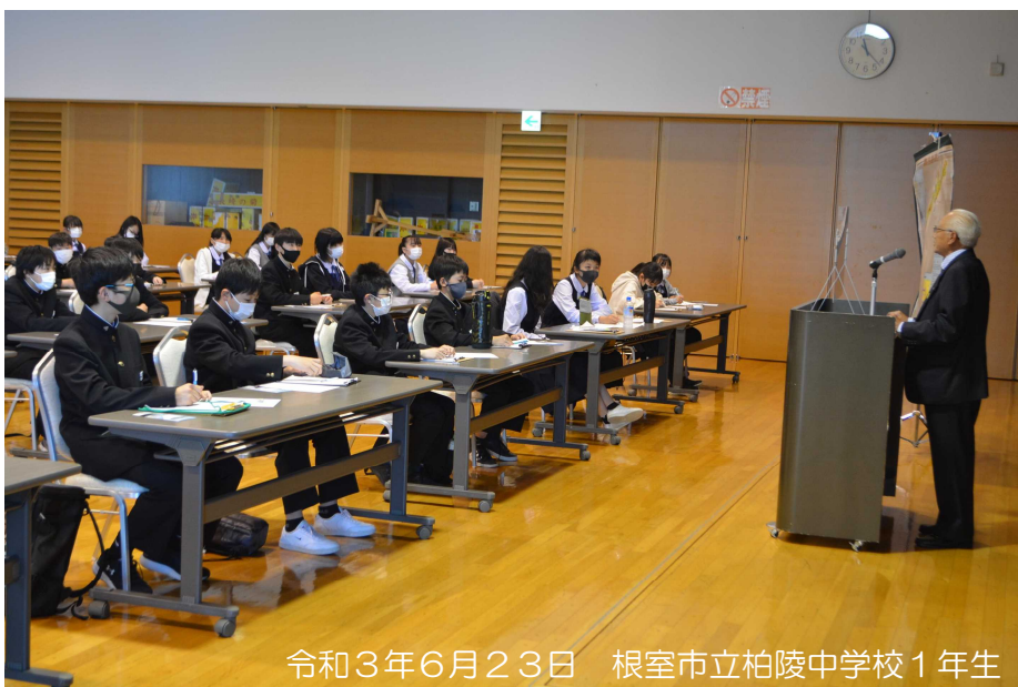
令和3年6月23日 根室市立柏陵中学校1年生

今年度の「北方少年少女塾」が終了しました。この事業は、根室管内の小中学生がニホロをはじめとする北方領土関連施設を見学し、元島民(2世・3世を含む)による講話を聞くなどして北方領土について学ぶもので、今年度は18校496名の児童・生徒が北方領土問題への理解を深めました。