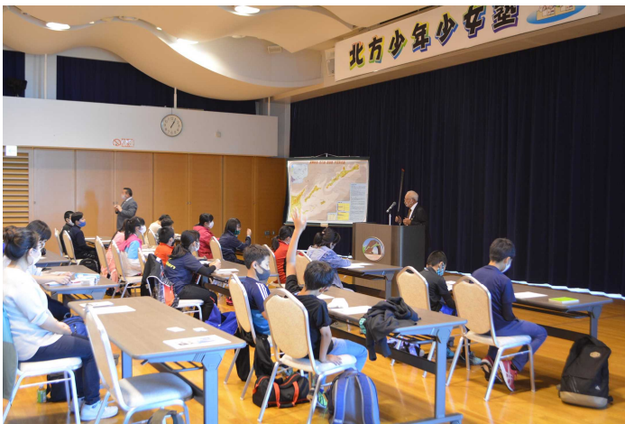
別海町立野付小学校5年生