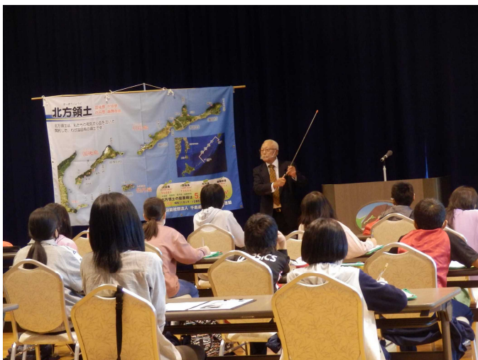
標津町立標津小学校5年生