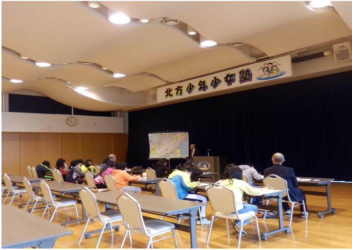
別海町立西春別小学校5・6年生

先月も根室管内の小中学校に通う児童・生徒の皆さんが、北方少年少女塾で来館しました。