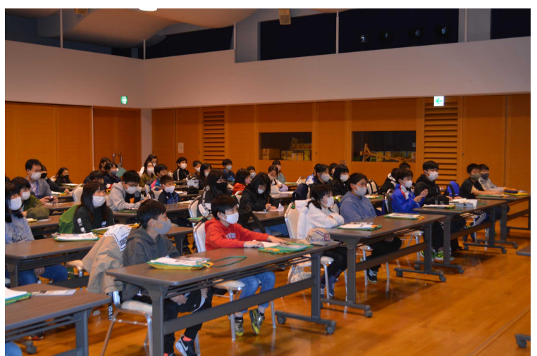
根室市立北斗小学校5年生