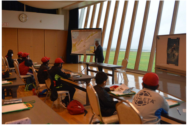
根室市立歯舞学園5年生