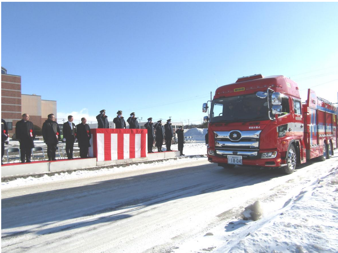
平成31年 消防出初式 (災害対応特殊水槽付消防ポンプ自動車)