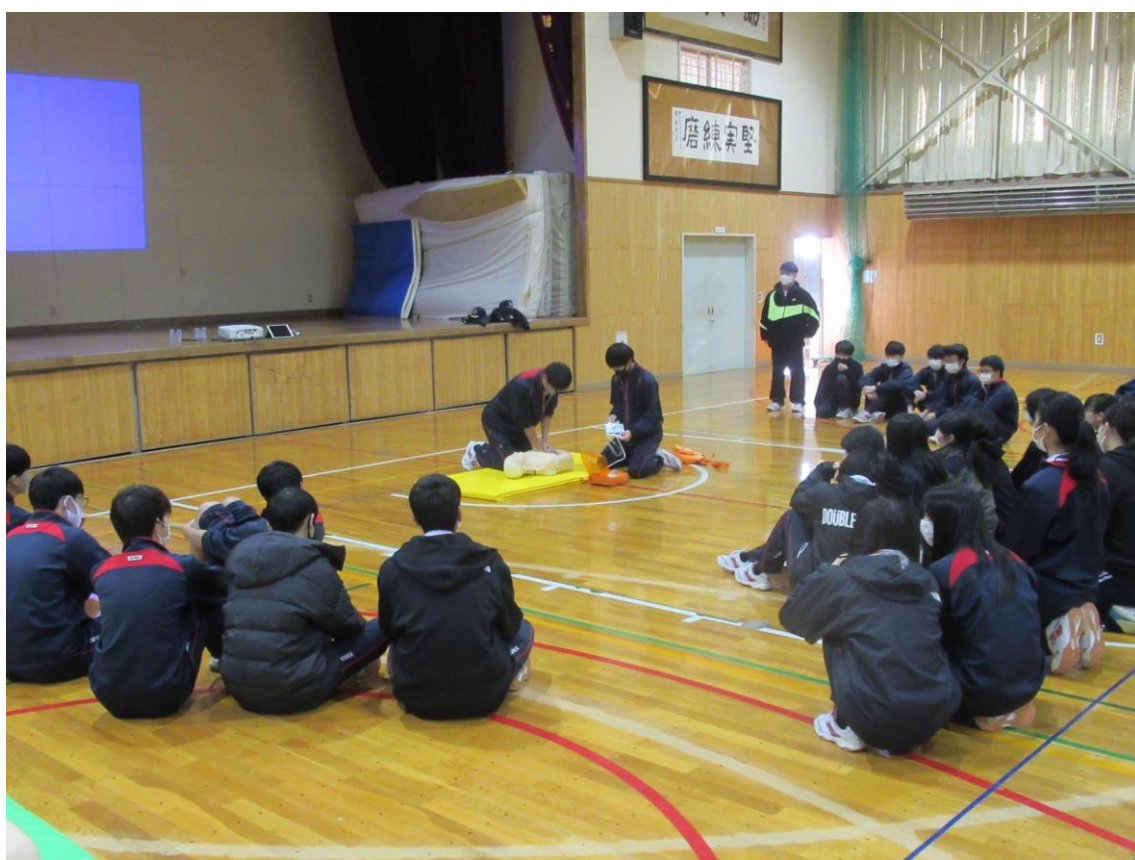
根室高等学校 救急救命講習