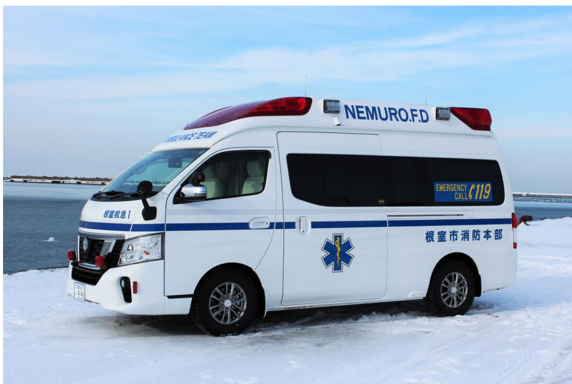
新高規格救急自動車（根室救急1）