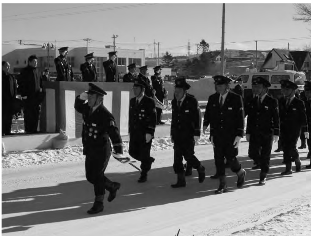
平成22年消防出初式