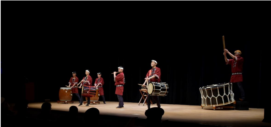
昆布盛太鼓保存会による太鼓演舞