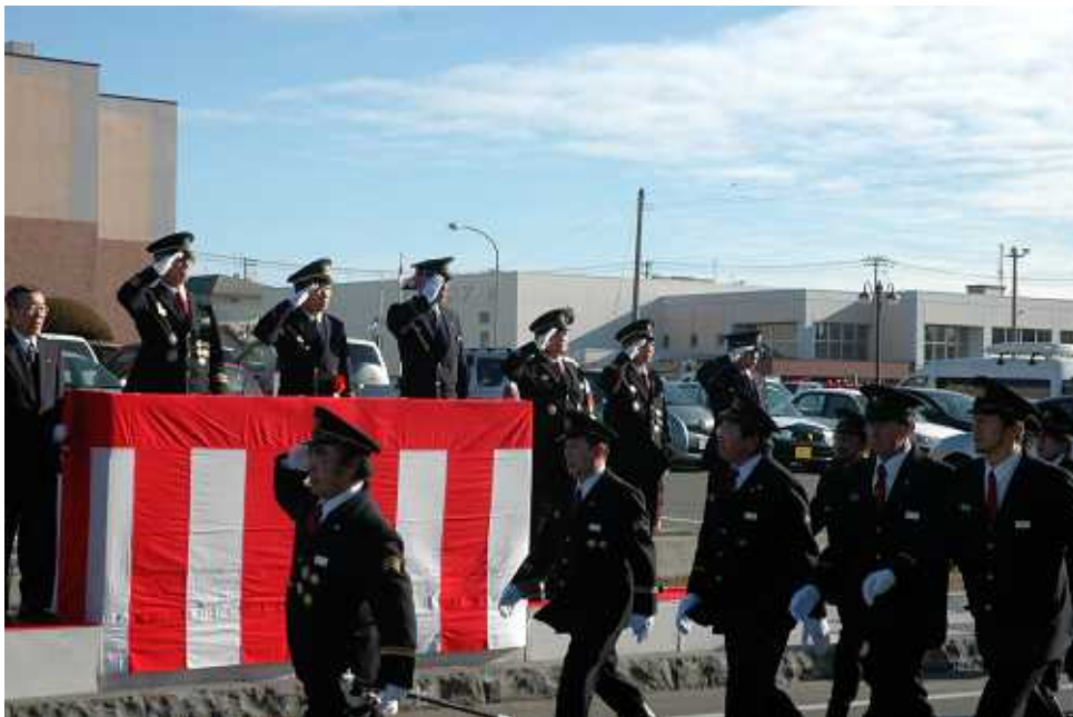
平成21年消防出初式