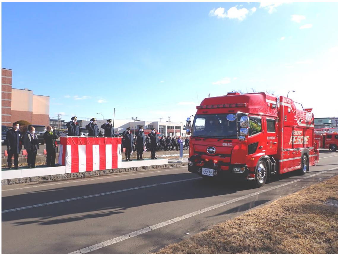
令和5年消防出初式