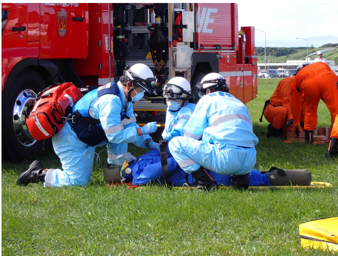
根室市総合防災訓練