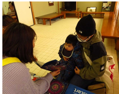
▲ 子どもブックライフ応援事業 「ブックスタート事業」