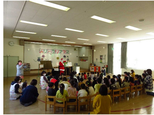
▶「メリリー・サンタクロース 図書館からのおくりもの」