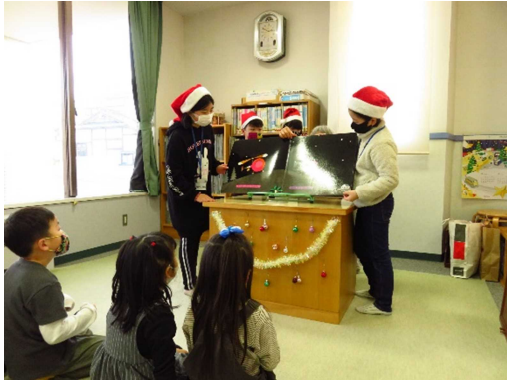
▶「3・4・5年生 親子読書会」