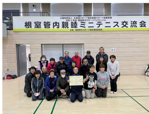
▲根室管内親睦ミニテニス交流会