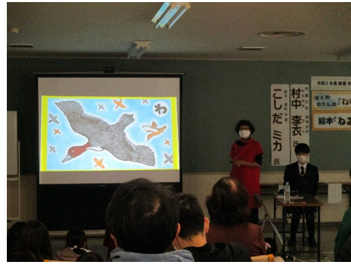
▶「子どもブックライフ応援事業講演会」 絵本『ねむろんろん』ができるまで おはなし会とスライド上映