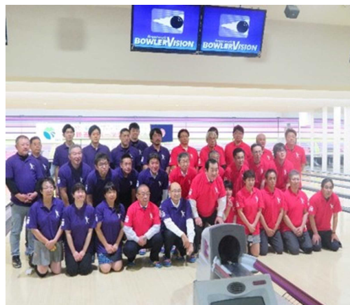
▲黒部市・根室市姉妹都市 親善スポーツ交歓会（ボウリング）