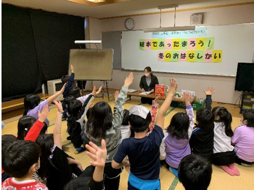
▶「読書推進 学校等訪問事業」