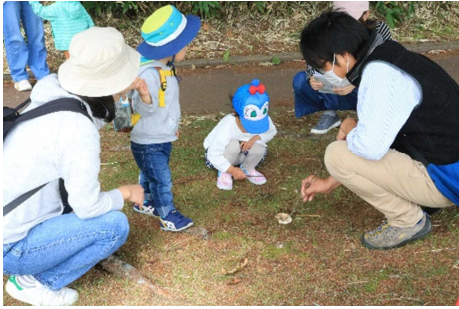
▲あそびの広場 「明治公園散策」