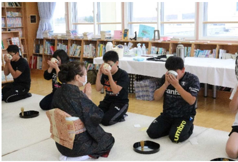
▲伝統文化・郷土芸能体験プログラム 「茶道体験」