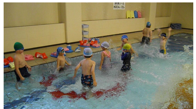
▲チビッ子水泳教室