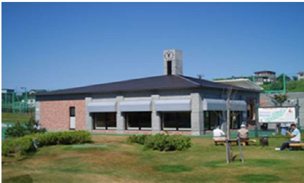
▲総合運動公園パークゴルフ場管理棟