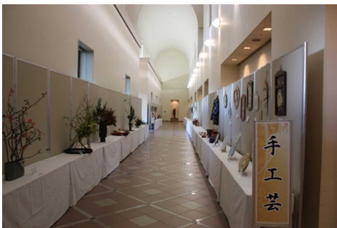
▲根室市文化祭「総合展示」