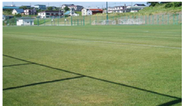
▲総合運動公園サッカー・ラグビー場