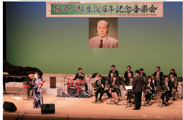
▲ふるさとの作曲家 飯田三郎生誕百年記念音楽会