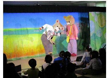
▲ 子どもブックライフ応援事業 「劇団バク人形劇公演」