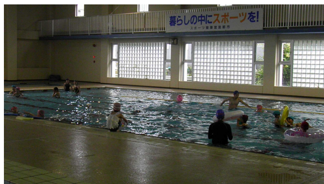
▲市民皆泳の日記念無料開放