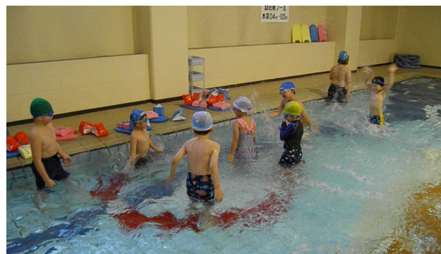
▲チビッ子水泳教室