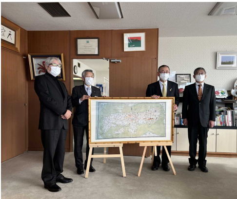
▲大黒屋光太夫作成日本地図複製寄付受納