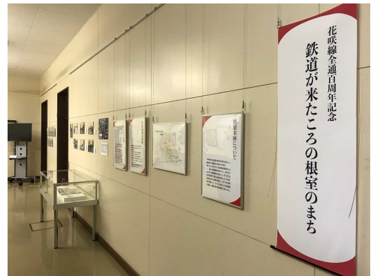
▲花咲線全通百周年記念企画展 「鉄道が来たころの根室のまち」