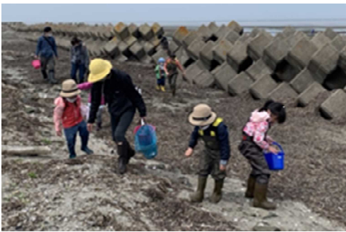
▲自然観察会「春の春国岱でビーチコーミング！干潟の生物を探してみよう！」