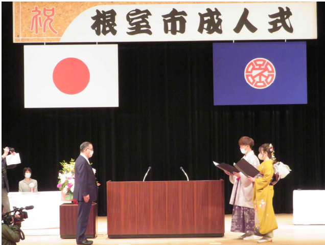
▲令和3年 根室市成人式（5月2日実施）