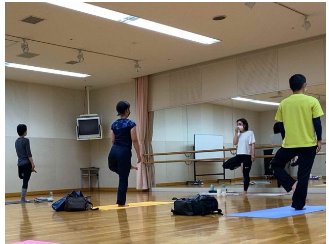
▲若ものの学園（ヨガ講座）