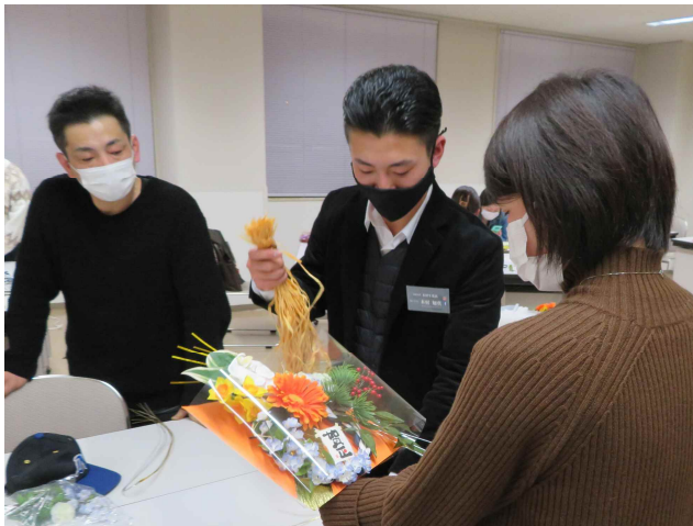
▲若ものの学園（しめ飾り講座）