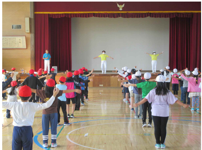
▲教えて！地域の先生（ラジオ体操指導）