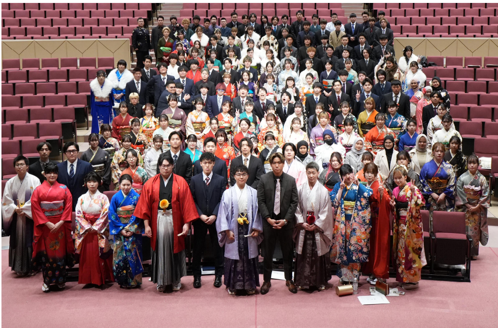
令和7年根室市20歳のつどい