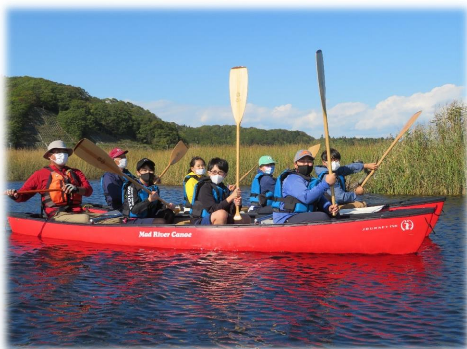
令和3年度子ども会リーダー研修会 特別事業「LET'Sたいけん！」