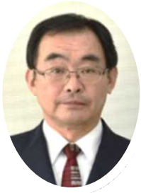
教育長 寺脇 文康