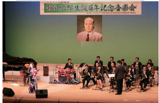
▲ふるさとの作曲家 飯田三郎生誕百年記念音楽会