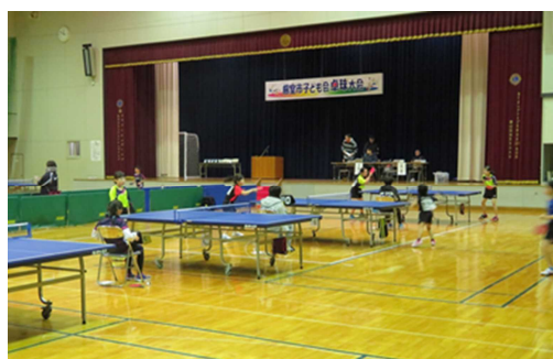
▲根室市子ども会卓球大会