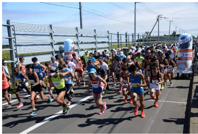
▲第3回最東端ねむろシーサイドマラソン