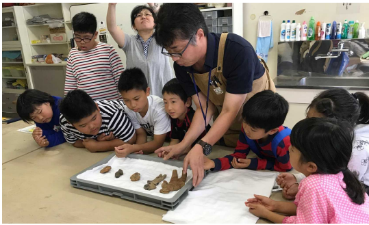
▲ワークショップ「ミニチュア土偶作り講座」