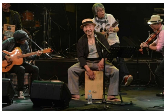
◀根室市文化祭 「サウンド ウェーブ 2018」