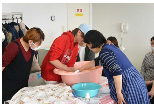
▲パパママ学級 「赤ちゃんのお風呂」(沐浴の説明と実習)