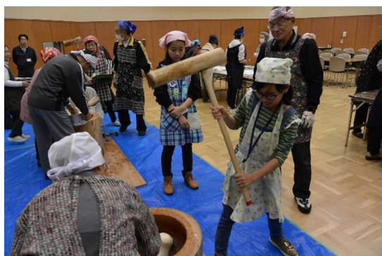
▲寿大学 「子ども会リーダー研修会と餅つき交流」