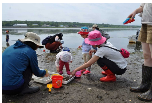
▲あそびの広場 野外活動 「春国岱：海の生物観察会」