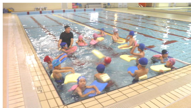
▲チビッコ水泳教室