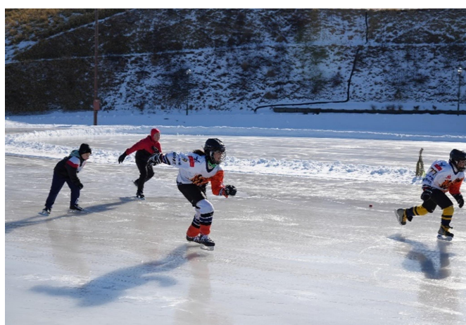
▲ 第 2 回根室市スケートフェスタ