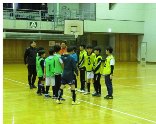
▲ 第 51 回根室市フットサル選手権大会 (U-12 小学生の部)