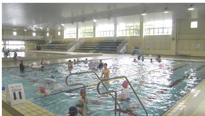
▲水泳の日記念無料開放