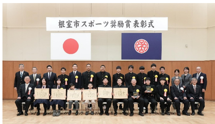
▲令和6年度根室市スポーツ賞並びにスポーツ奨励賞表彰式

根室市社会教育計画並びに根室市スポーツ推進計画に基づき、生涯スポーツの観点に立ち、幼児から高齢者の各年齢層や四季を通したスポーツ活動の普及と、いつでも、どこでも気軽に楽しめるレクリエーションスポーツや軽スポーツの開発と、市民一人1スポーツの生活化を目指した生涯スポーツの普及・振興を図ることを目的とする。