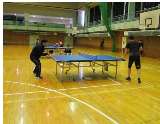
▲ 第 10 回根室市長杯卓球選手権大会