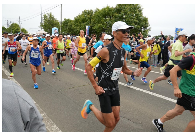
▲ 第 8 回最東端ねむろシーサイドマラソン