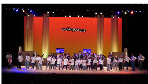
▲みんなでオンステージ in ねむろ