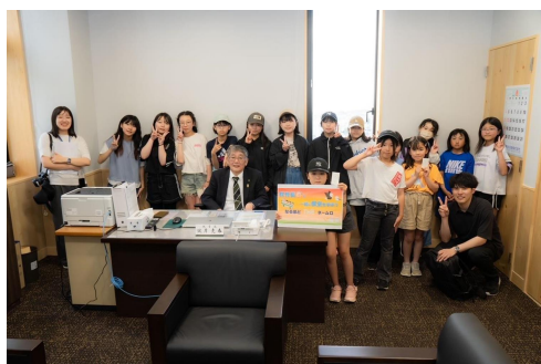
▲教育長と一緒に根室を学ぼう 「なるほど THE ネ〜ムロ」