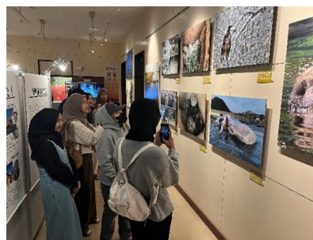
▲巡回展『カメラは見た動物たちの素顔 in 根室』の様子