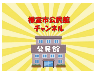
▲根室市公民館チャンネル