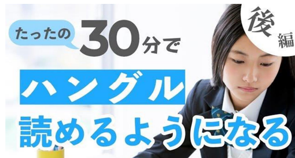
▲たった30分でハングルが読めるようになる方法