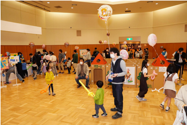
▲令和6年度 第2回ねむろこどもフェス