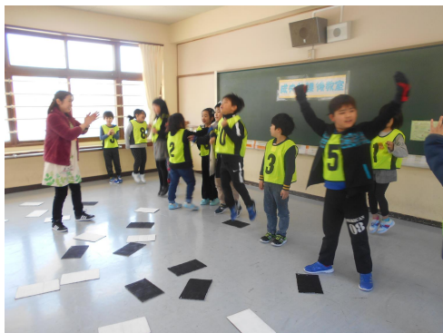
▲新年おたのしみ会