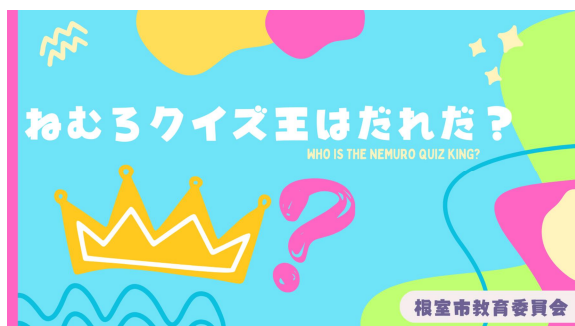
▲ねむろクイズ王はだれだ？