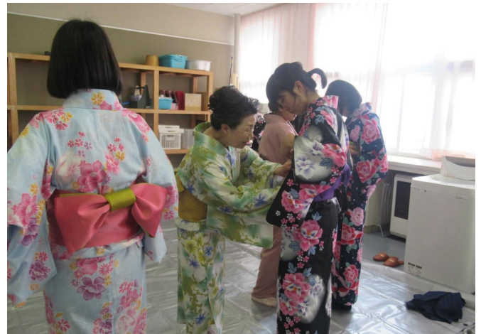
▲教えて！地域の先生（着付け教室）