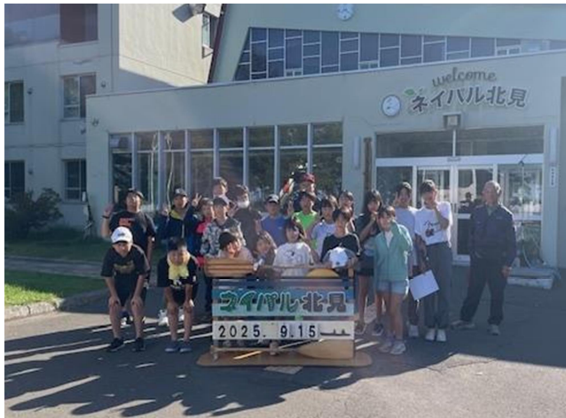
▲子どもリーダー研修会