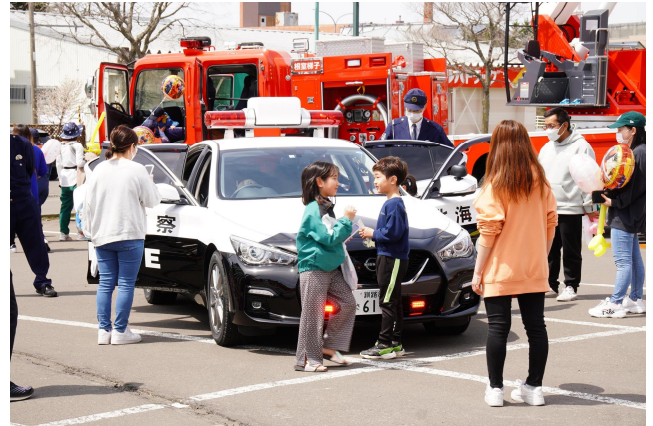
▲令和6年度 第2回ねむろこどもフェス