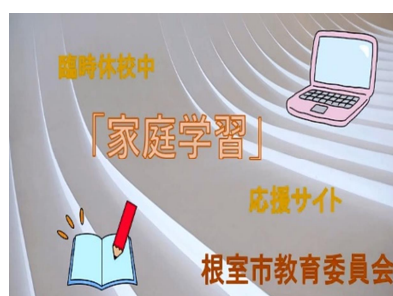
▲家庭学習応援サイト