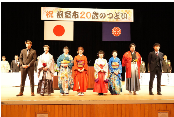
▲令和7年 根室市 20歳のつどい