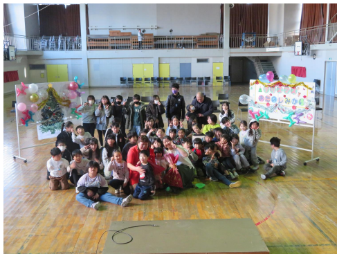
▲北斗クリスマス会