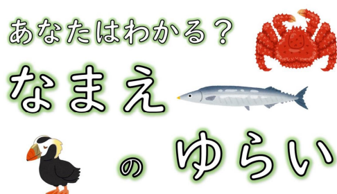
▲あなたはわかる？なまえのゆらい