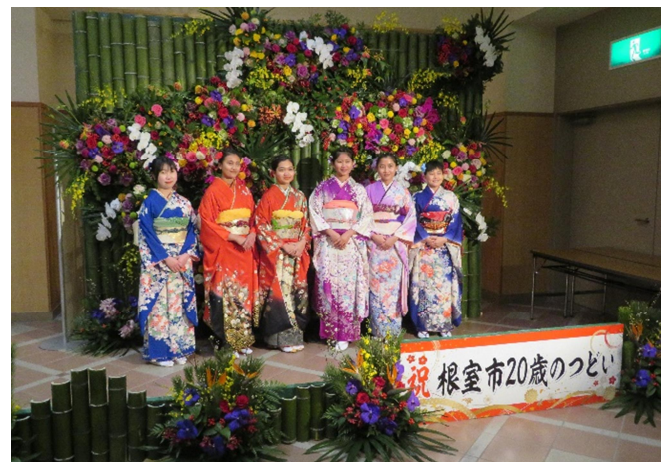
▲外国人技能実習生和服着付け体験 (根室市 20歳のつどい)