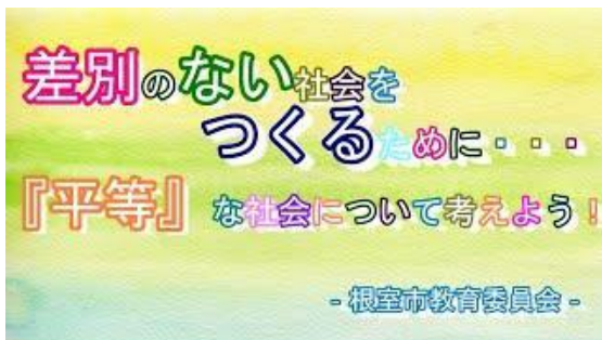
▲差別のない社会をつくるために・・・ 「平等」な社会について考えよう！