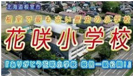
▲ありがとう花咲小学校校舎