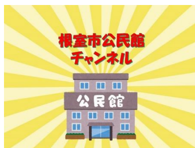
▲根室市公民館チャンネル