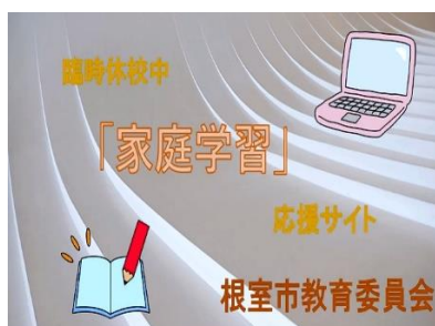
▲家庭学習応援サイト