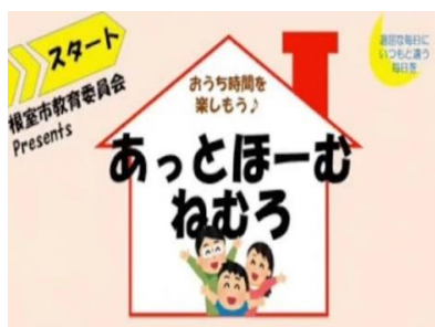
▲あっとほーむ ねむろ