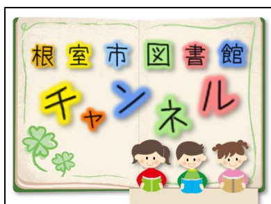
▲根室市図書館チャンネル