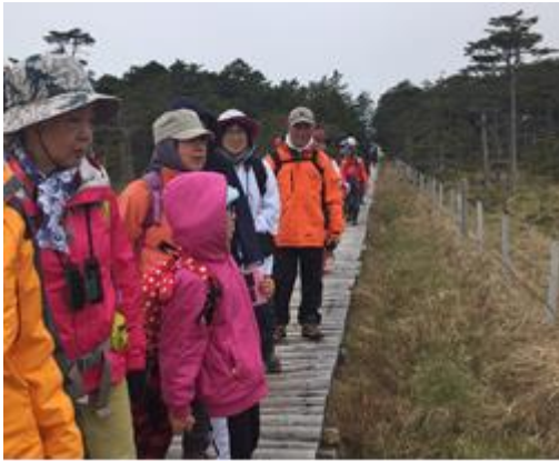
▲自然観察会（落石岬）