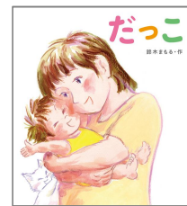
『だっこ』 鈴木 まもる／作 小峰書店