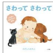
『さわってさわって』 えがしら みちこ／作 小学