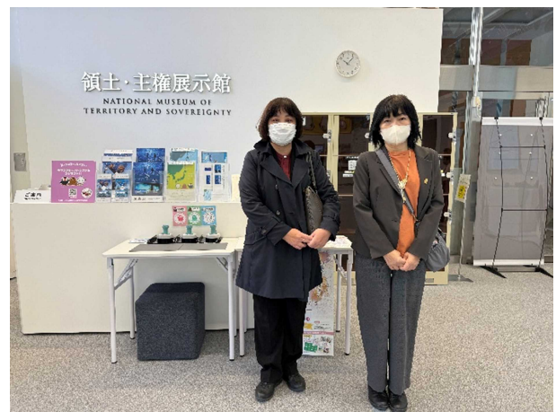
北方領土・竹島・尖閣諸島の展示が行われている