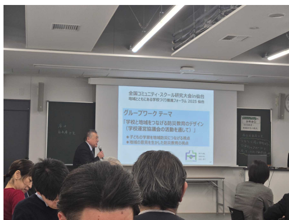
グループディスカッションの様子。