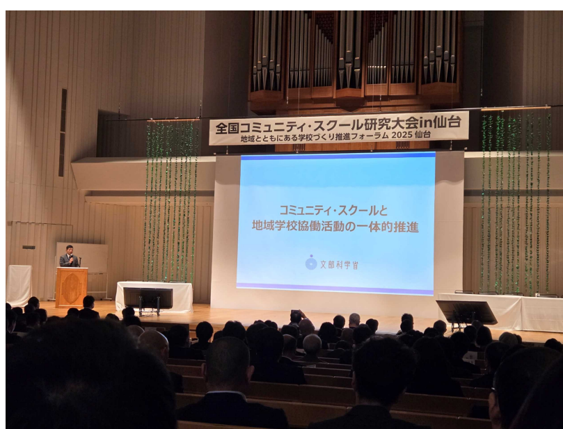
文部科学省による説明。

行政を含めた地域の組織をまとめたものであり、そこにコミュニティスクールが関わっている。ガソリンスタンドの運営（広島県安芸高田市）やライドシェアの実施（岡山県笠岡市）などが事例としてある。コミュニティスクールの関連では石川県白山市立美川小学校が空き家の活用方法についてまちづくり協議会が小学生の提案を聞く機会を設け、子どもと共に地域課題の解決を図っていく事例が紹介された。地域運営組織とコミュニティスクールがうまく連携している事例がある一方で、さらに地域の担い手の不足の深刻化が予想される中での対応が求められ、現場の連携を進めるためにも、自治体内の教育委員会と首長部局のコミュニケーションが大切であると担当者は述べた。