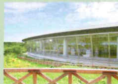
道の駅「スワン44ねむろ」

■住所/根室市酪陽1番地 ■開館時間/9:00~18:00 (7月~8月)、その他の期間は9:00~17:00 ■休館日・開館時間の詳細は下記へお問い合わせ下さい。 ■電話/0153-25-3055