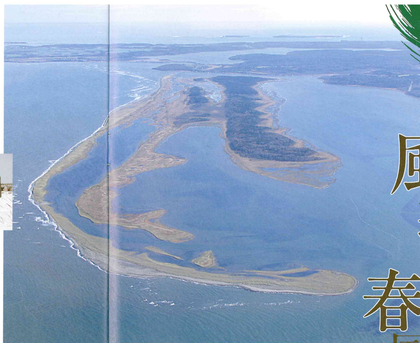
3つの砂洲から成る春国岱全景

オオハクチョウが飛来する、風蓮湖。湖水面積57.5km 2 、周囲96km、根室市と別海町をまたぐ汽水湖(淡水と海水が混ざった塩分の低い水をたたえる湖で、砂洲によって海と隔てられた潟であることが多い)です。周囲には広大な湿原、森林、砂丘など変化に富んだ自然が広がり、日本で見ることできる野鳥の半数以上約330種が観察できます。 春国岱は第一砂丘、第二砂丘、第三砂丘の3つの砂洲から成っており、長さ約8km、最大幅1.3km、面積は約6000haもあります。第二砂丘は1000~1500年前、第三砂丘の列は3000年前にできたとされています。第一砂丘には国内最大級のハマナスの大群落があり、第二砂丘には砂丘上に生まれた珍しいアカエゾマツの純林、第三砂丘には巨木が生い茂り、原始の森を思わせる。